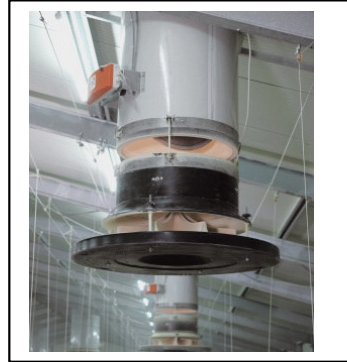
Zuluftkamin für Gleich- oder Überdrucklüftung